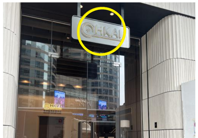
6 到達博思醫學診斷中心