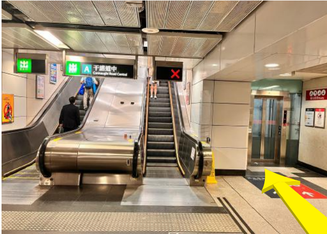
1 乘坐中環港鐵站 A1 出口旁升降機