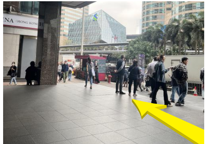
4 沿干諾道中往前走