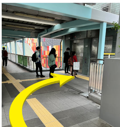
5 越過彌敦道後，乘搭升降機往下至地面