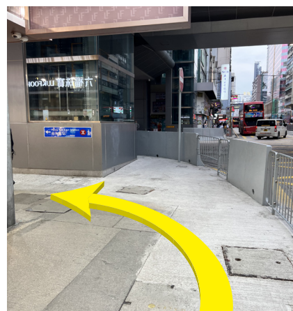
3 乘搭天橋升降機往上