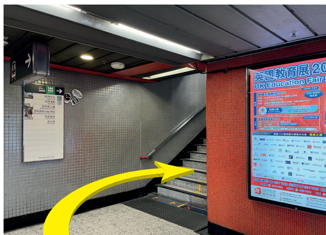
2 前往 D2 出口