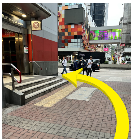
2 A1 出口面向彌敦道左轉