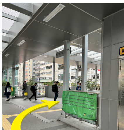
4 出升降機後轉向右後方