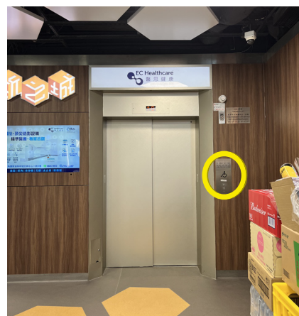
9 乘搭升降機按 4 字前往到達博思醫學診斷中心