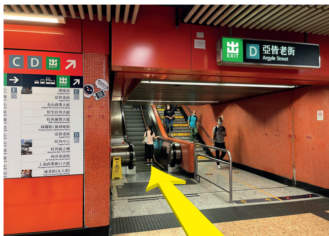
1 旺角港鐵站 D 出口