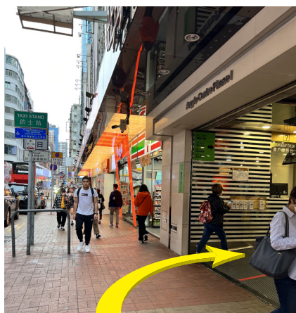
8 到旺角中心商場入口