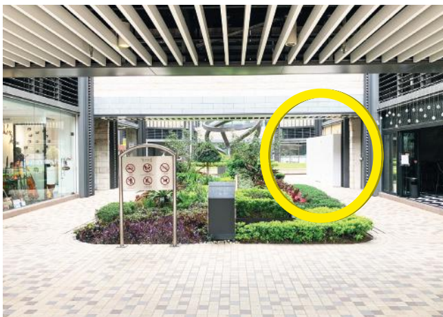
5 進入世宙，中心就在右邊 11-12 號舖