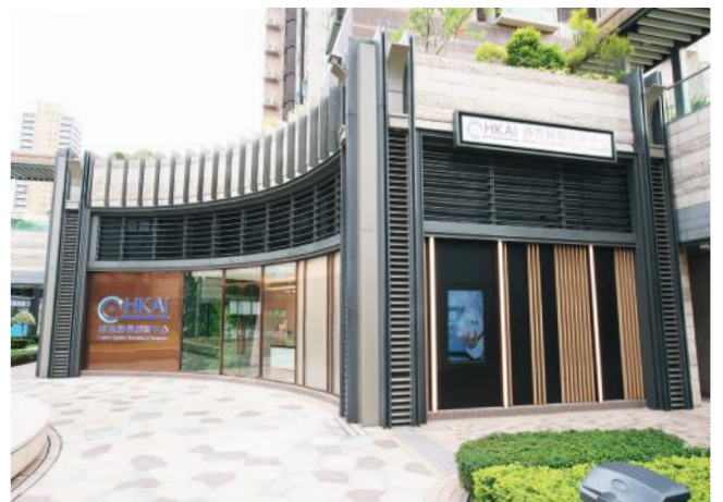
6 到達博思醫學診斷中心