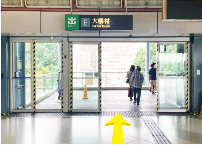
1 朗屏西鐵站 E 出口