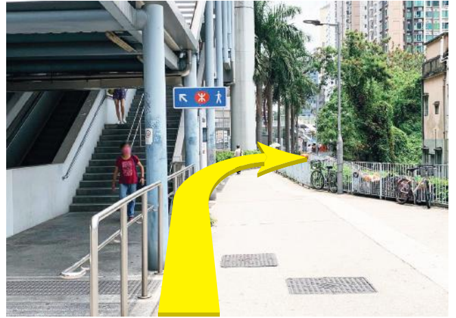
2 沿此方向直走及轉右